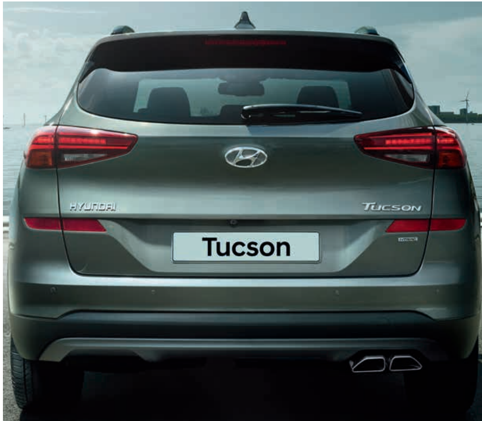
Neues, markantes Heckdesign