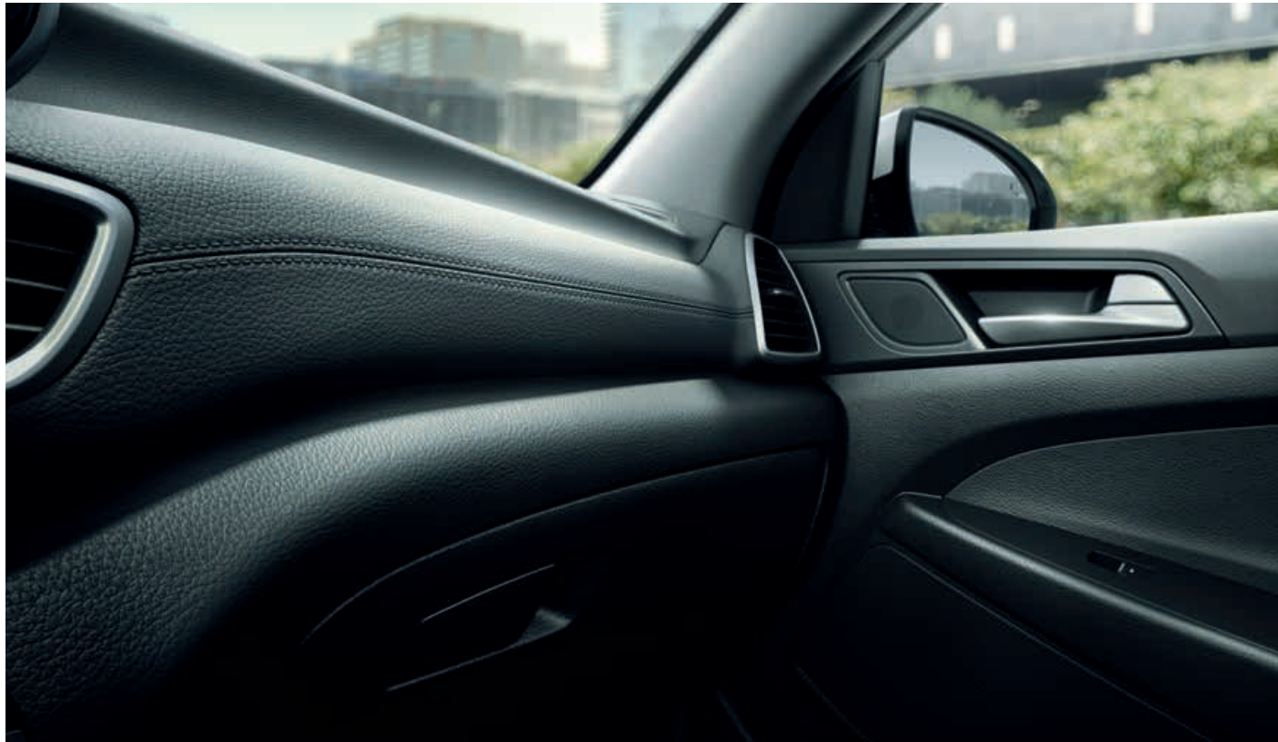
Armaturenbrett mit Lederoptik 2