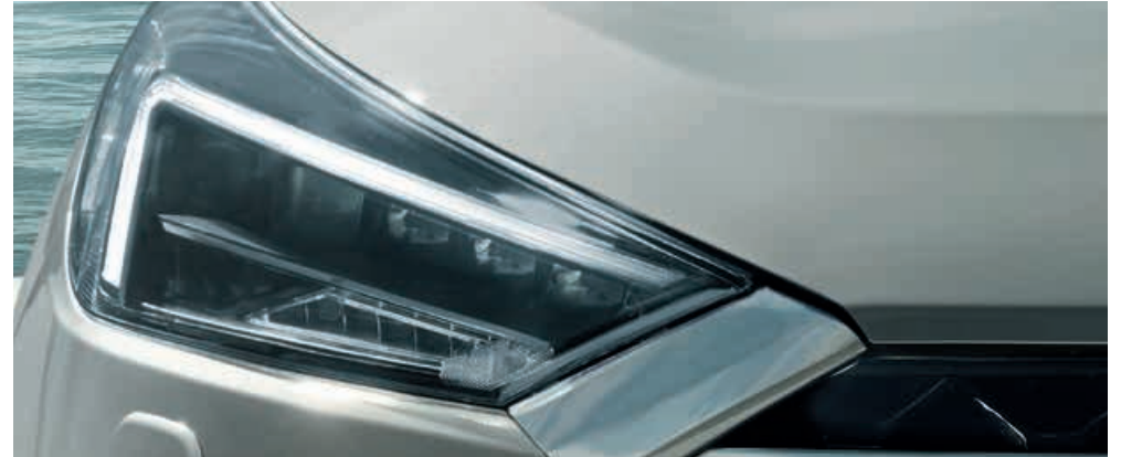
Voll-LED-Scheinwerfer mit Fernlichtassistent LED-Tagfahrlicht und Nebelscheinwerfer