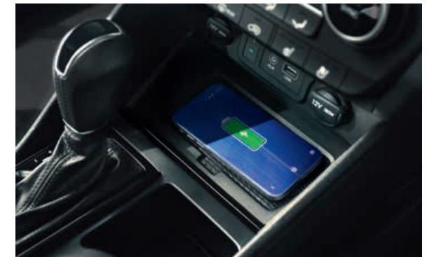
Kabelloses Aufladen des Smartphones 3