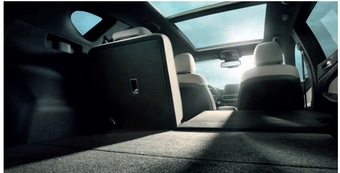
Rücksitzlehne im Verhältnis 60:40 umklappbar

2 Dieselmotoren bis 1.449 l bzw. 1.492 l