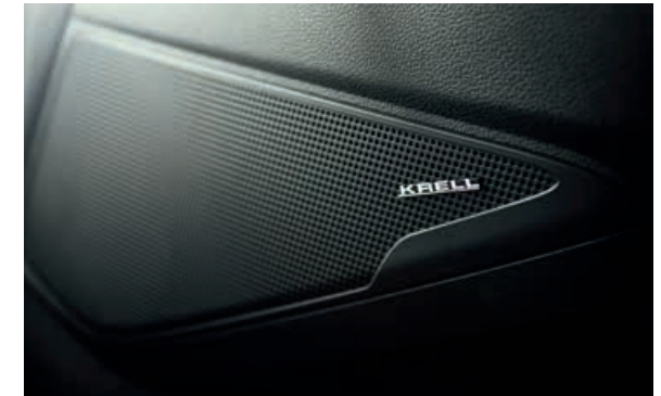
KRELL – Premium Sound System