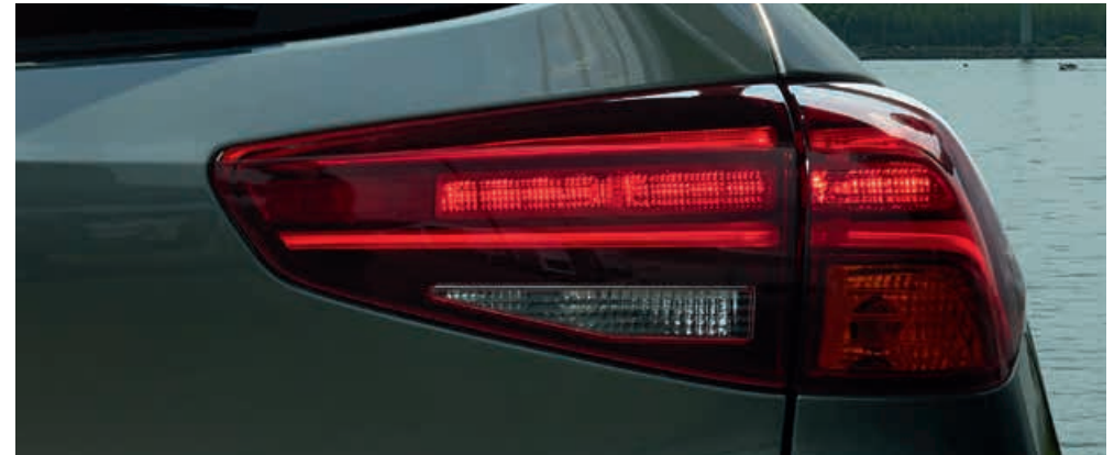
LED-Heckleuchten Doppelrohr-Auspuff in Chrom